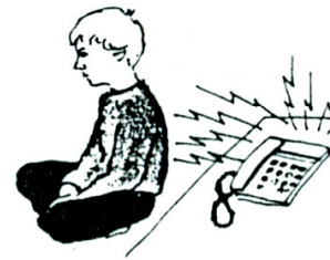
Reagerer ofte ikke på lyd