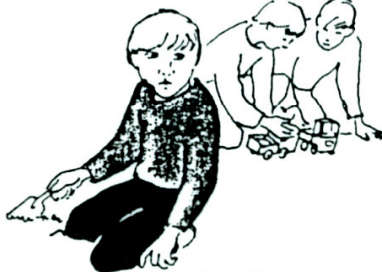
Leger ikke med andre børn