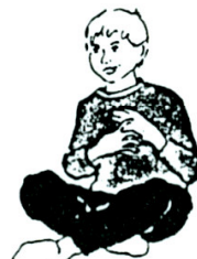
Griner eller friser uden grund