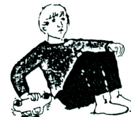
Bruger legetøj på en besynderlig måde

Har svært ved at acceptere forandringer i den daglige rutine