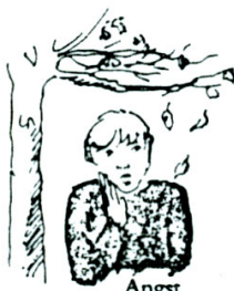
Angst for ufarlige ting