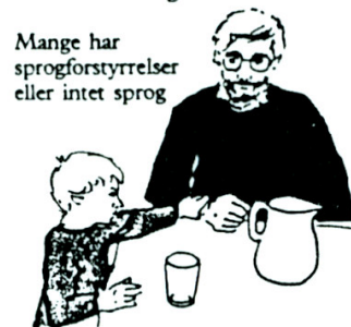
Udtrykker behov med bevægelser