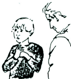
Reserveret over for andre mennesker